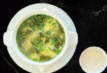
Зеленый борщ с яйцом и сметаной