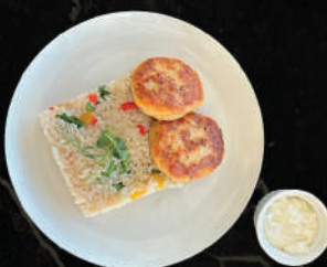
Рыбные биточки с рисом