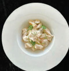
Куручка в сливочном соусе с овощами