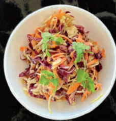
Салат Коул Слоу