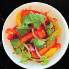
Салат Кавказский с красной фасолью